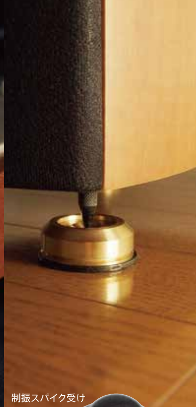
制振スバイク受け