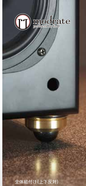
全体組付け(上下反対)